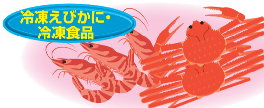
冷凍えびかに・ 冷凍食品