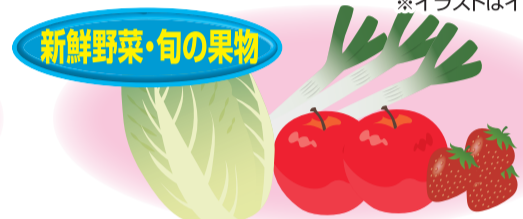
新鮮野菜・旬の果物