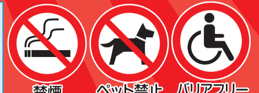
禁煙 ペット禁止 バリアフリー

平素は当市場をご利用頂き誠にありがとうございます。 皆様一人一人の「新型コロナに対するマナー」によって当市場は営業できております。運営方針のご理解、何卒よろしくお願いいたします。